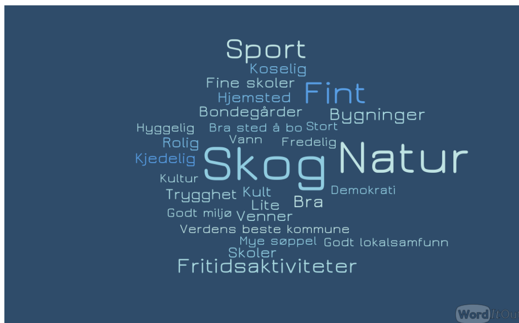
Figur 4 Mest brukte ord for å beskrive Nittedal. Ord brukt 5 eller flere ganger

Det er stort mangfold og stor bredde i beskrivelsen av Nittedal med tre ord. Fire ord skiller seg likevel ut og går igjen klart flest ganger i beskrivelsen av Nittedal. De to som er mest benyttet er skog og natur , som går igjen hhv. 75 og 68 ganger. Videre benyttes ordet fint 41 ganger og sport/idrett 34 ganger. Ordskyen under, der størrelsen på ordene reflekterer hyppigheten av bruk av ordet, viser alle ord som går igjen 5 eller flere ganger.