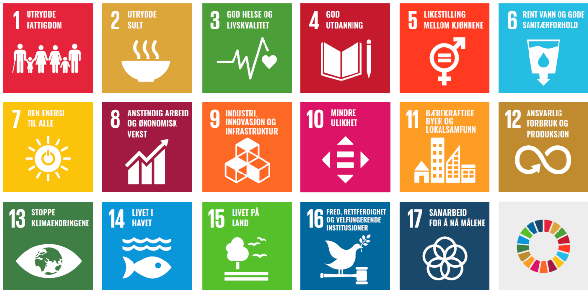
Figur 1 FNs bærekraftsmål