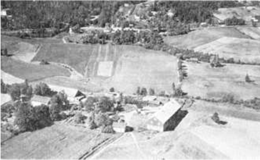
Flyfoto av Søndre og Nordre Slattum i 1949.