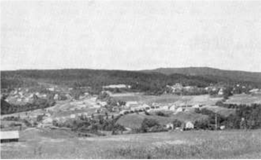
Bebyggelsen på Slattum sett fra Nittedal kirke. Slattum skole ligger oppe i åsen midt på bildet.

I 1670 ble Søndre Slattum solgt til to eiere, og de hadde hver bygselrett over en halvpart. De bygslet garden til en og samme bruker fram til 1714, da ble det to oppsittere. De hadde husa ved ett tun til ut på 1800-tallet. Brukeren av den delen av garden som nå kalles Nedre Slattum, flyttet da ut fra fellestunet til husmannsplassen Brenntnghaugen og tok den i bruk sammen med den jorda han hadde fra før. Først etter 1850 ble tomter og parseller solgt fra Slattum.