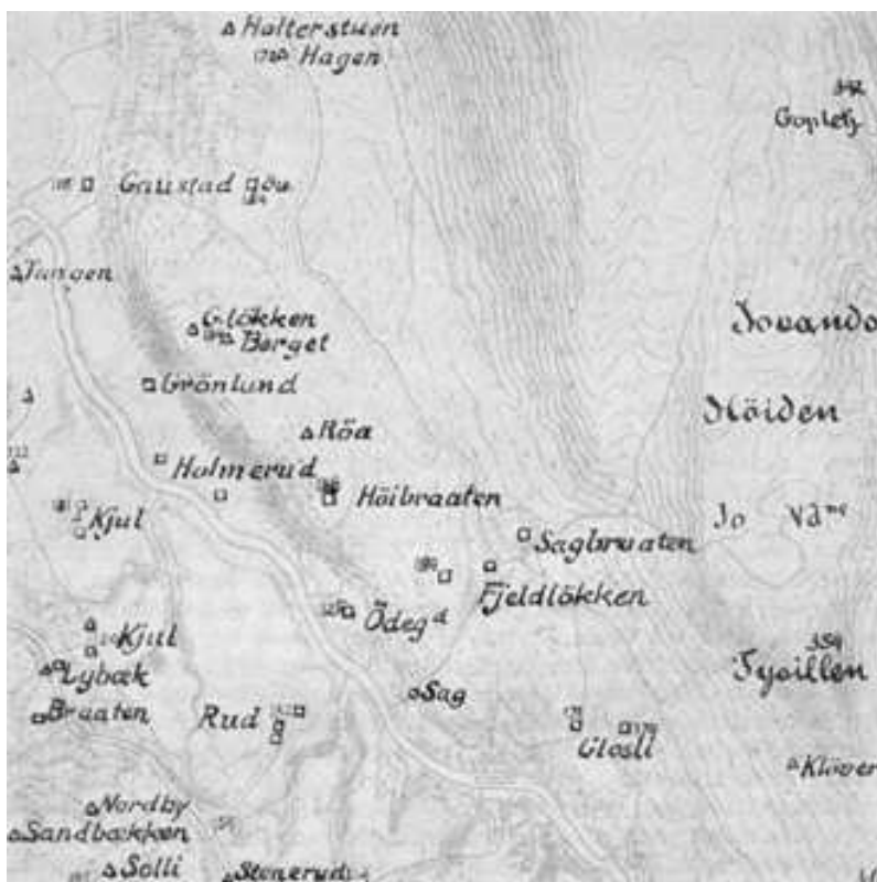
Utsnitt av rektangelkartet fra 1881 for området Hauger-Holter.