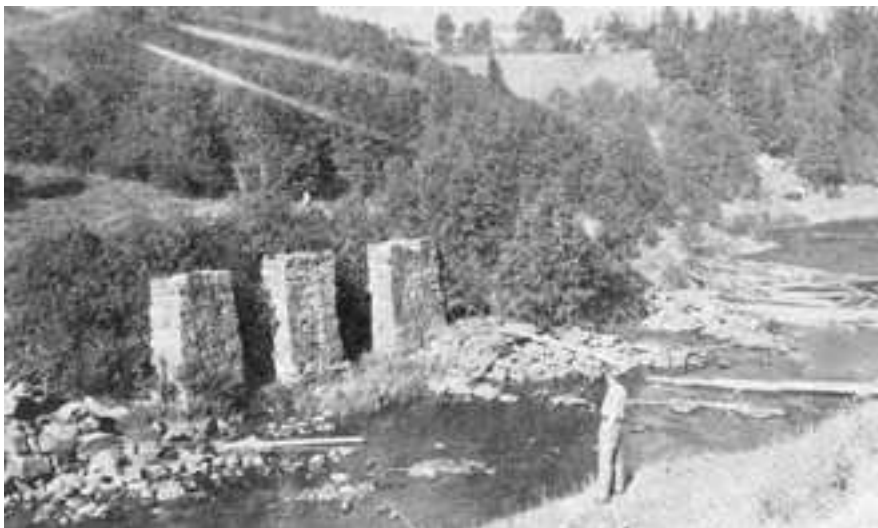
Rester av Slattum sag.

og 1 sau i Styrrerud. Utsæden var \frac{3}{8} tn. bygg, \frac{7}{8} tn. havre, \frac{1}{8} tn. erter og 1\frac{3}{4} tn. poteter. Ti år etter var det 2 kuer i plassen, og det ble sådd \frac{1}{2} tn. bygg og 2 tn. poteter. Pike Birgitte Iversd. Styrrerud, f 1820, døde i 1888.