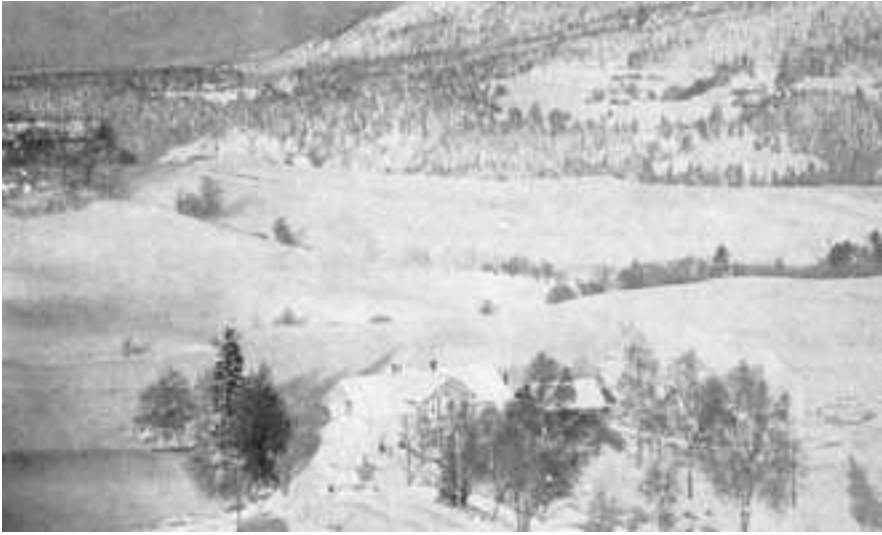
Flyfoto av Nedre Slattum fra 1955. Låven på Nordre Slattum sees ned til venstre. I bakgrunnen Fjelløkka og Glosli.