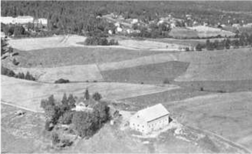
Flyfoto av Nedre Slattum i 1958. Slattum skole til venstre på bildet.

Sagbruket ble solgt fra garden i 1888 og var i bruk til først på 1900-tallet. Kverno. blir omtalt første gang i 1680. Bøndene omkring kunne male der «hvis de hadde fornøden, når vannet til sagene derved ingen hinder begås». Ennå omkring siste århundreskifte var det spor etter den gamle kverna.