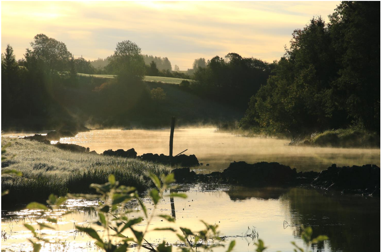
Motiv: Nitelva ved Åros bru.