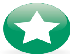
Kompetente og motiverte medarbeidere